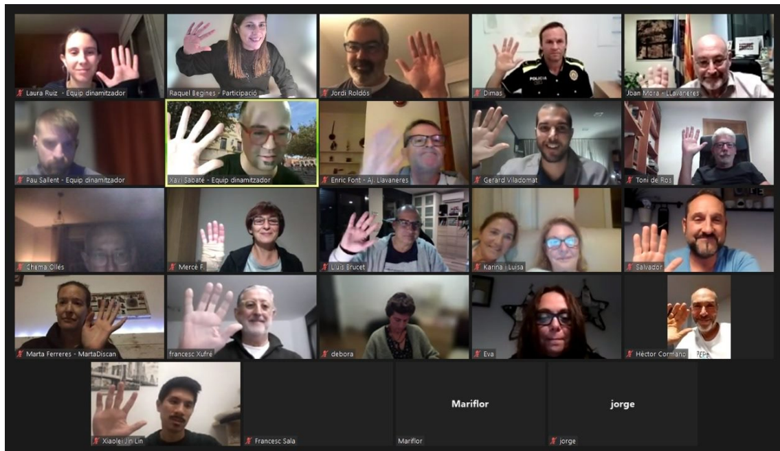
Foto de la sessió

Resposta: Sí, s'ha de moure a la via pública. És a propòsit que no siguin al mateix lloc (la majoria) que les bateries dels contenidors. Cal canviar els hàbits de la gent per tal que no segueixin essent petites deixalleries...