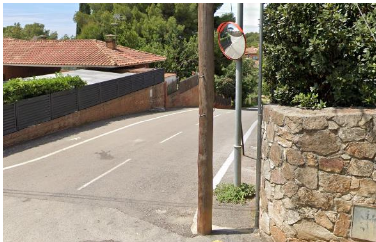
Mirall al qual fa referència la qüestió.

Es tracta d'un mirall que està tapat per un pal de llum i quan es va en direcció contrària s'ha de treure molt el cotxe per poder tenir visibilitat. L'Ajuntament estudiarà com resoldre el problema.