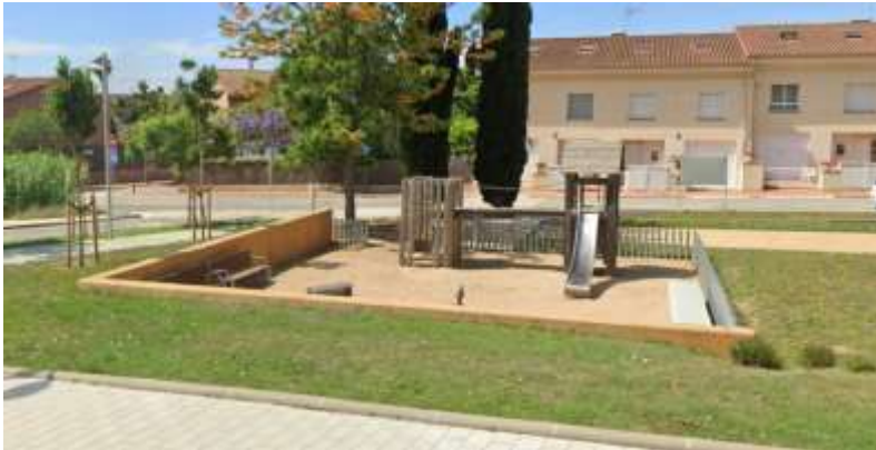
Font: Google Street View. Consulta desembre 2023. Zona que esmenta la qüestió.

S'estudiarà la instal·lació de cautxú o d'altres materials per millorar el paviment del parc infantil (ara és de sorra). Sobre la millora general dels parcs infantils, també sortirà una licitació per a la millora del parc del Primer d'Octubre (ubicat al Centre).