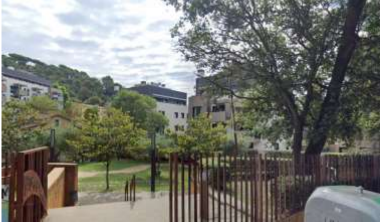
Font: Google Street View. Consulta desembre 2023. Zona que esmenta la qüestió.

S'ha demanat al lampista que deixi algun punt il·luminat, però que apagui els focus durant la nit, quan el parc està tancat.